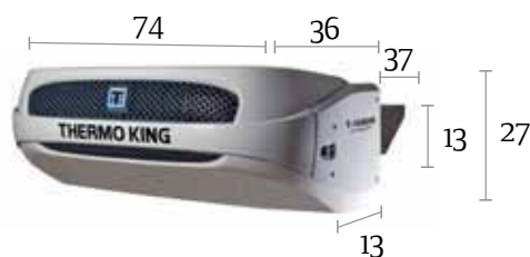
T-1080R / T-1080S